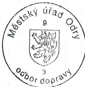
„otisk úředního razítka“